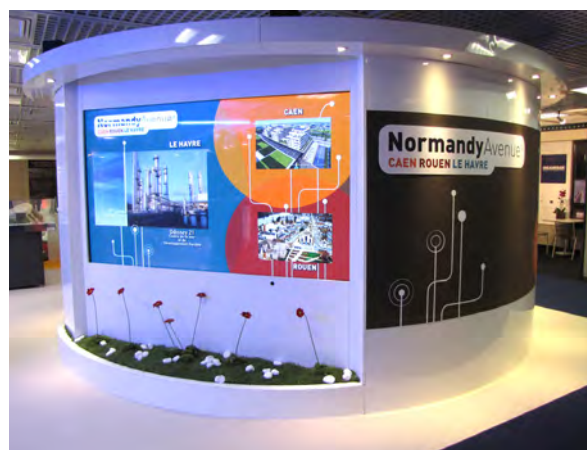
Normandy Avenue au MIPIIM 2010

A l'heure où la compétition territoriale s'exacerbe pour conquérir projets d'investissements et implantations d'entreprises, les agglomérations de Caen, Rouen et du Havre présenteront une nouvelle fois un front commun au MIPIIM, fédérées sous la marque « Normandy Avenue ». Une démarche vertueuse et originale initiée il y a 5 ans.